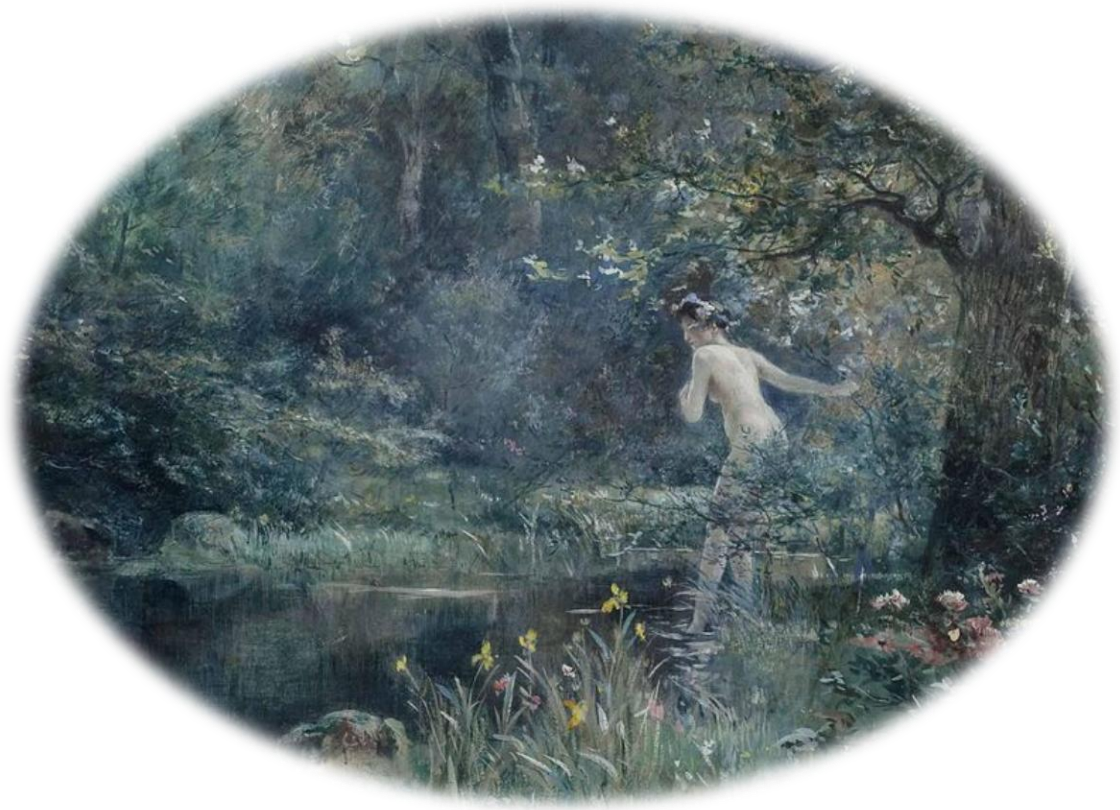
Frederick Vezin (1859 – 1933): Badenixe im Waldbach

Die vergeistigte "hohe" und die körperbetontere "niedere" Minne werden oft als voneinander getrennte Sphären betrachtet. In den Minneliedern Walthers von der Vogelweide können beide allerdings auch ineinander übergehen.