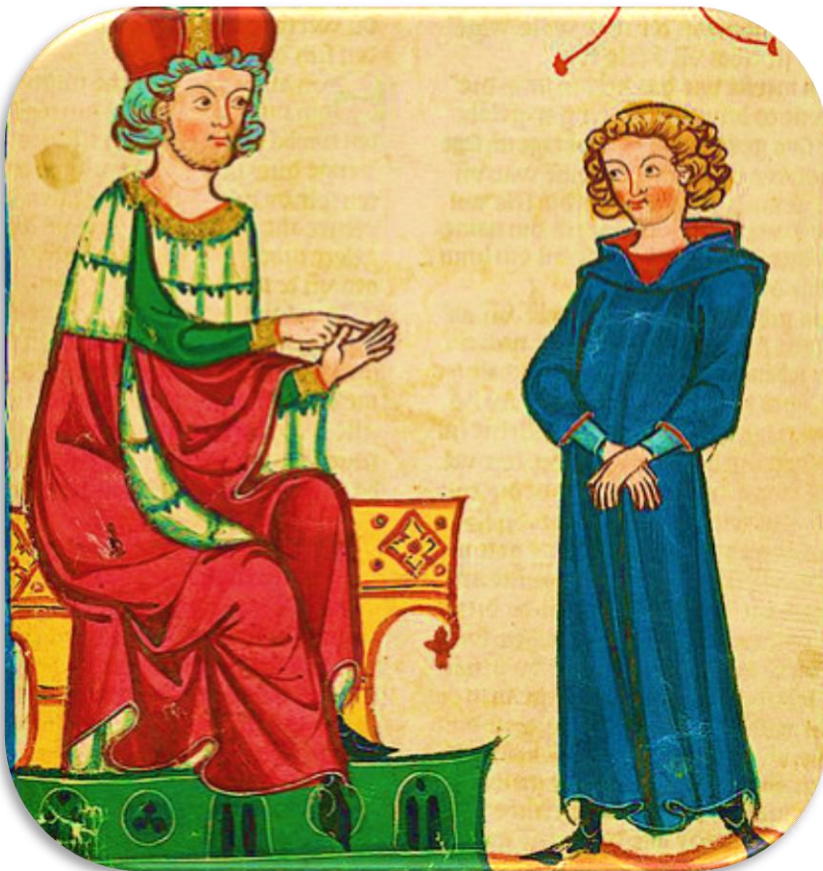
"Der Winsbeke"; Abbildung in der Großen Heidelberger (Manessischen) Liederhandschrift (Codex Manesse), um 1300

Als fahrender Sänger war Walther von der Vogelweide sein Leben lang auf die Mildtätigkeit seiner Gönner angewiesen. Bittgesänge und belohnungsträchtige Lobpreisungen der Reichen und Mächtigen waren daher ein fester Teil seines dichterischen Repertoires.