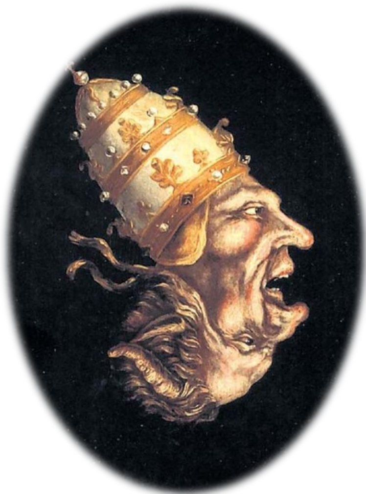
Die zwei Gesichter des Papstes; Papst-Karikatur aus dem 16. Jahrhundert Utrecht/Niederlande, Museum für religiöse Kunst (Museum Catharijneconvent); Wikimedia commons

Walther von der Vogelweide hat teilweise sehr heftige Kritik an Papsttum und Amtskirche geübt. Darin spiegelt sich die religiöse Erneuerungssehnsucht seiner Zeit, aber auch der Machtkampf zwischen Papst- und Kaisertum wider.