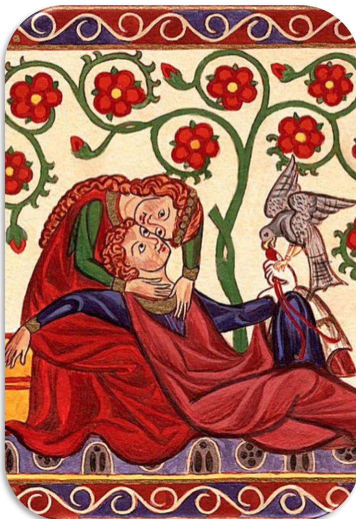
Begleitbild für Konrad von Altstetten aus der Großen Heidelberger (Manessischen) Liederhandschrift

Walthers "Mädchenlieder" beruhen auf dem Ideal der "ebenen Liebe". Gemeint ist damit eine Liebe, die – jenseits aller Konventionen – nur auf der gegenseitigen Zuneigung zweier Menschen füreinander gründet.