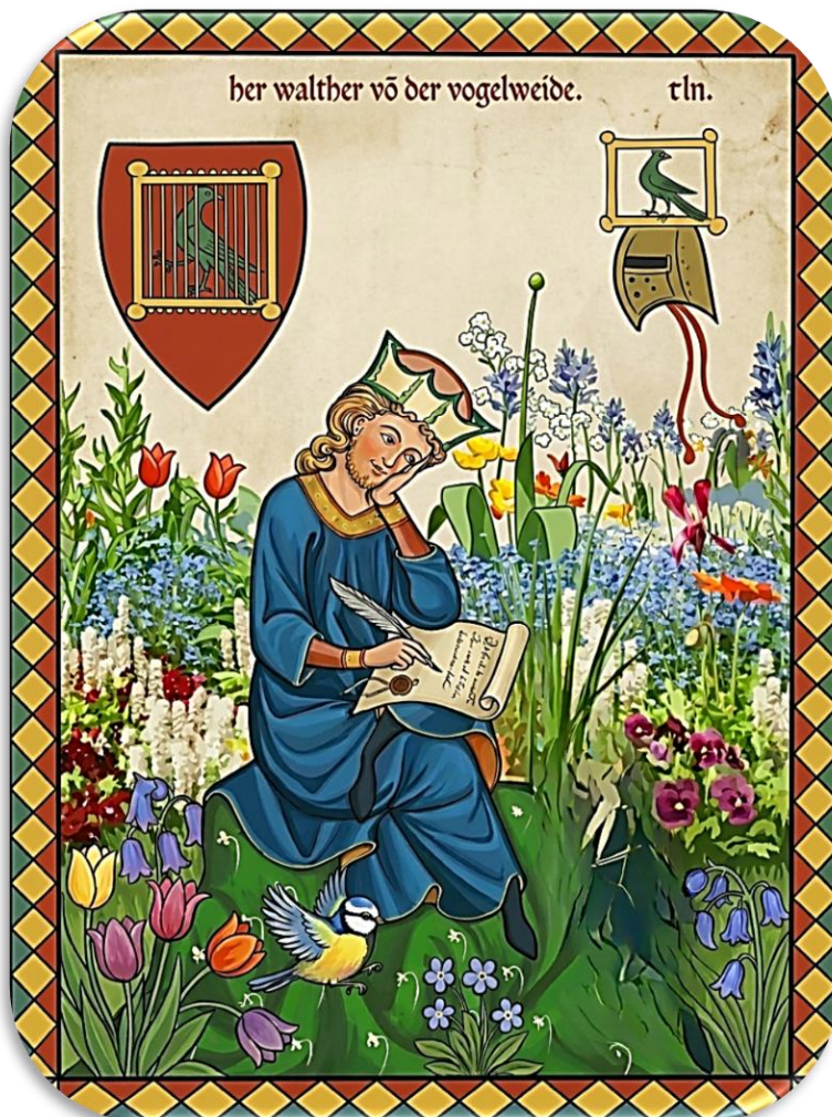
Collage mit dem Porträt Walthers von der Vogelweide in der Großen Heidelberger (Manessischen) Liederhandschrift (Codex Manesse; um 1300)

Der Frühling läutete im Mittelalter nicht einfach nur die wärmere Jahreszeit ein. Er war auch das Tor zu einem freieren, ungebundeneren Leben. Dies erklärt die Euphorie, mit der Walther von der Vogelweide den Frühling begrüßt und in seinen Wintergedichten herbeisehnt.