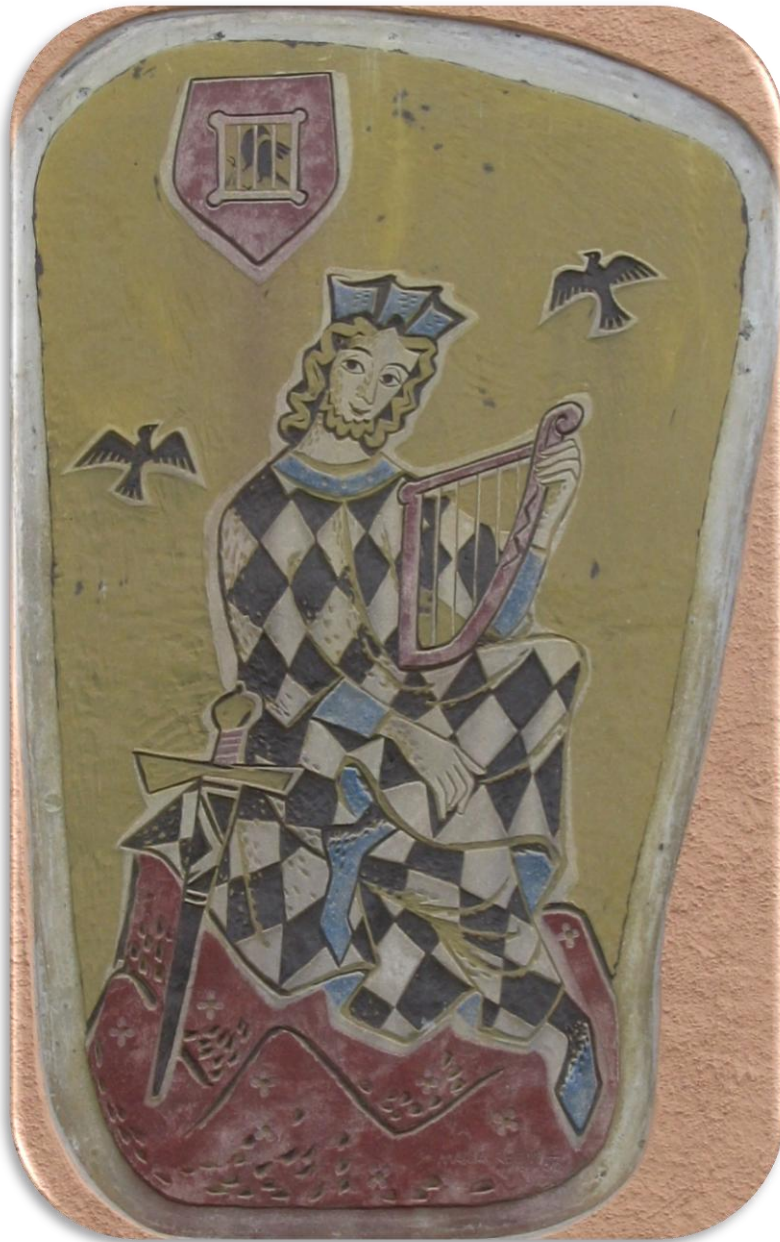
Maria Rehm (1905 – 2002): Sgraffito von Walther von der Vogelweide am ehemaligen Österreichischen Hof in Innsbruck-Wilten (1956) Foto von Luftschiffhafen aus dem Jahr 2018 (Wikimedia commons)