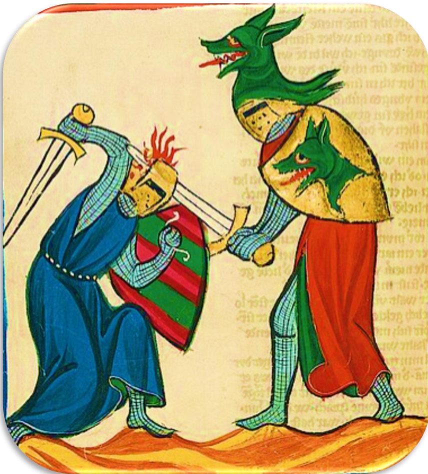
"Dietmar der Setzer"; Abbildung in der Großen Heidelberger (Manessischen) Liederhandschrift (Codex Manesse), um 1300

In seiner berühmten "Reichsklage" betont Walther von der Vogelweide die Notwendigkeit äußeren für die Erlangung inneren Friedens. Das Gedicht ist vor dem Hintergrund des mittelalterlichen Fehdewesens zu sehen, weist aber auch aktuelle Bezüge auf.