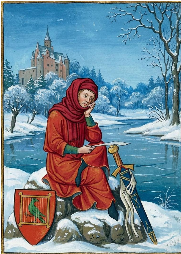
Collage mit dem Porträt Walthers von der Vogelweide in der Großen Heidelberger (Manessischen) Liederhandschrift (Codex Manesse; um 1300)

Den Widrigkeiten des Winters war man im Mittelalter weit stärker ausgesetzt als heute. Davon konnte auch Walther von der Vogelweide – im wahrsten Sinne des Wortes – "ein Lied singen".