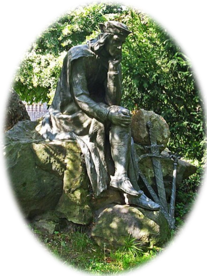
Denkmal für Walther von der Vogelweide in der tschechischen Stadt Duchkov (Nordböhmen), erschaffen 1911 von dem österreichischen Bildhauer Heinrich Karl Scholz (1880 – 1937); Foto: Zacatechnik, 2008 (Wikimedia commons)

In einer berühmten Elegie blickt Walther von der Vogelweide auf sein Leben zurück. Dessen Verlauf bleibt vielfach im Dunkeln, lässt sich jedoch in groben Linien aus seinen Versen rekonstruieren – denn in diesen nimmt er immer wieder auf politische Ereignisse seiner Zeit Bezug.