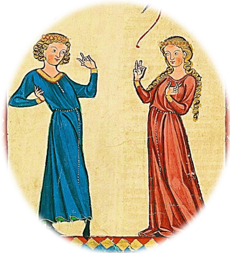
Begleitbild für Heinrich von Strelingen aus der Großen Heidelberger (Manessischen) Liederhandschrift

Auf der Suche nach dem rechten Maß (der "mâze") in der Liebe verwirft Walther von der Vogelweide allzu exzessive Sinnesfreuden. Aber auch der übersteigerten Verehrung der Angebeteten steht er skeptisch gegenüber.