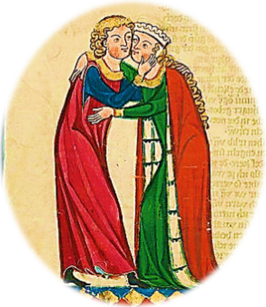
Begleitbild für Albrecht von Johansdorf aus der Großen Heidelberger (Manessischen) Liederhandschrift