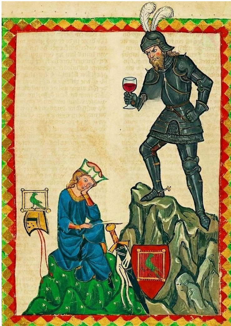
Collage mit dem Porträt Walthers von der Vogelweide in der Großen Heidelberger (Manessischen) Liederhandschrift (Codex Manesse; um 1300)

In der berühmten Abbildung in der Manessischen Liederhandschrift wird Walther von der Vogelweide als eine Art Dichterkönig porträtiert. Sein Alltag als Dichter war jedoch von so vielen Hindernissen geprägt, dass er sich kaum sehr "königlich" gefühlt haben dürfte.