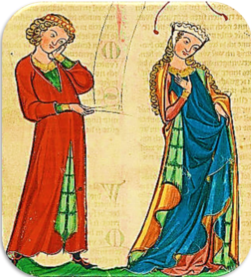
Begleitbild für Gottfried von Neifen in der Großen Heidelberger (Manessischen) Liederhandschrift

Walther von der Vogelweide hatte entscheidenden Einfluss auf die Entwicklung des Minnesangs. An seinem Werk lassen sich sowohl dessen Ursprünge als auch die spätere Ausdifferenzierung dieser Kunstform ablesen.