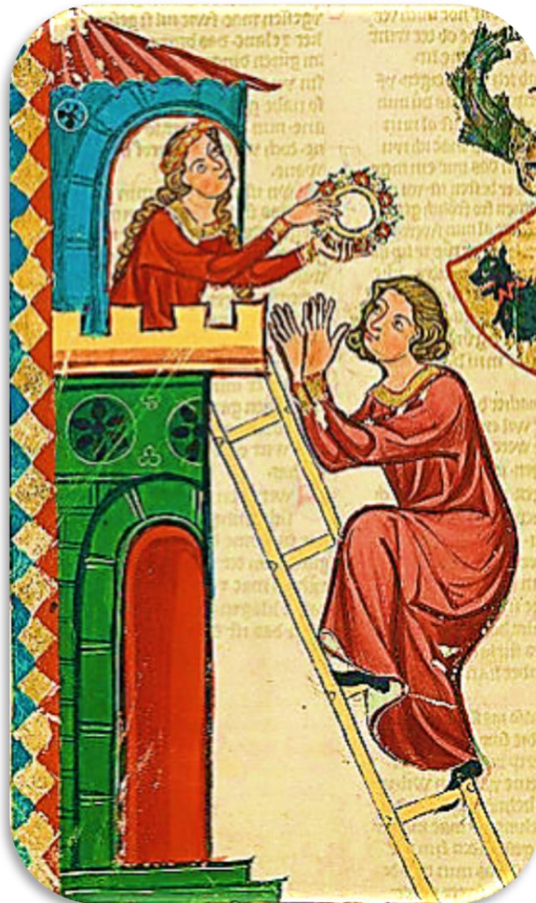
Begleitbild für Graf Kraft II. von Toggenburg in der Großen Heidelberger (Manessischen) Liederhandschrift

Kennzeichnend für die Lieder der "hohen" Minne ist die Gleichzeitigkeit von Lobpreis der verehrten Frau und Entsagung. Dafür lassen sich sowohl historische als auch soziologische Erklärungsmuster anführen.